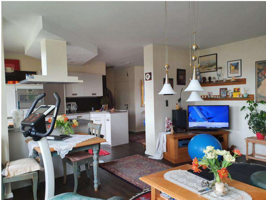
Wohnzimmer/ offene Küche