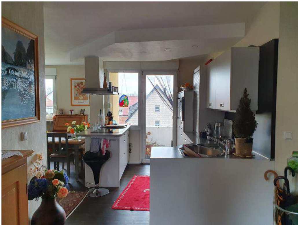
Blick vom Essbereich