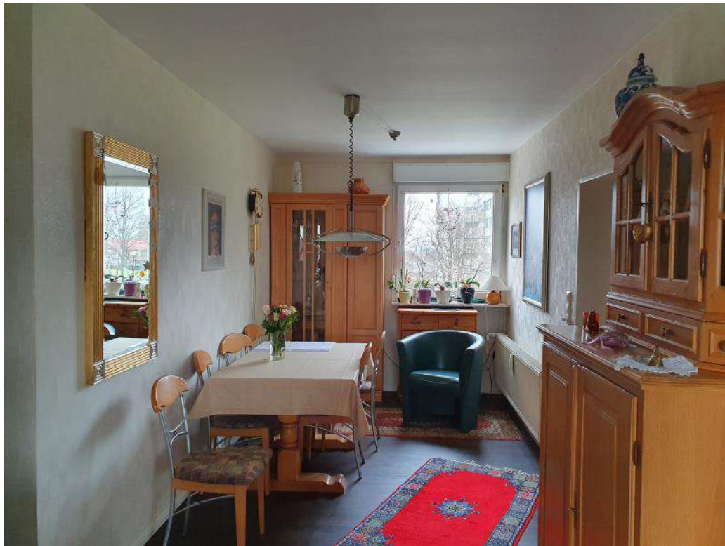
Blick in den Essbereich