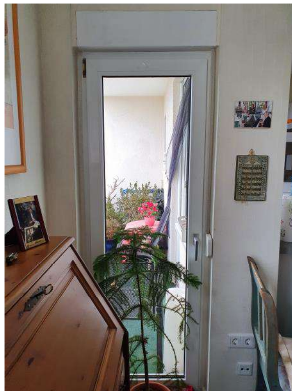
Blick zum kleinen Balkon