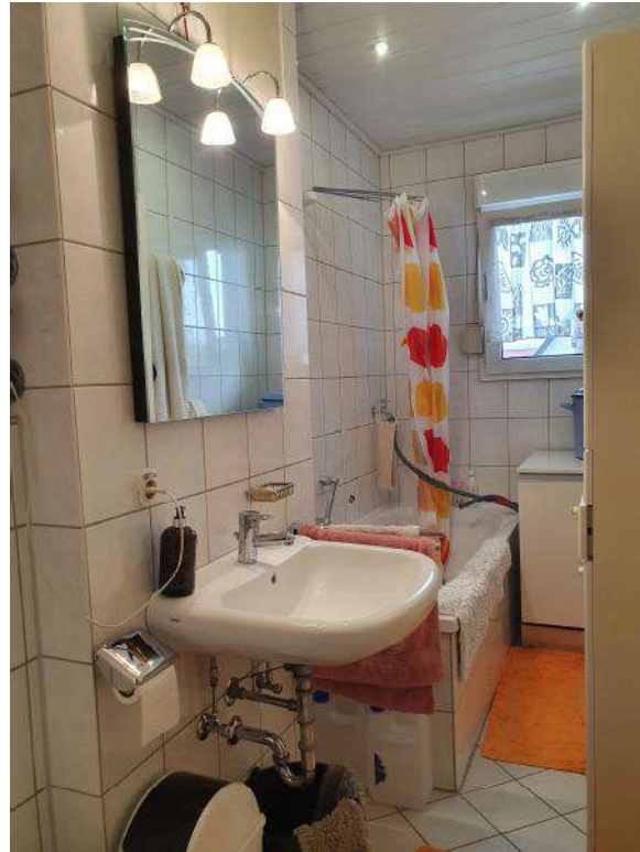
Badezimmer mit Badewanne