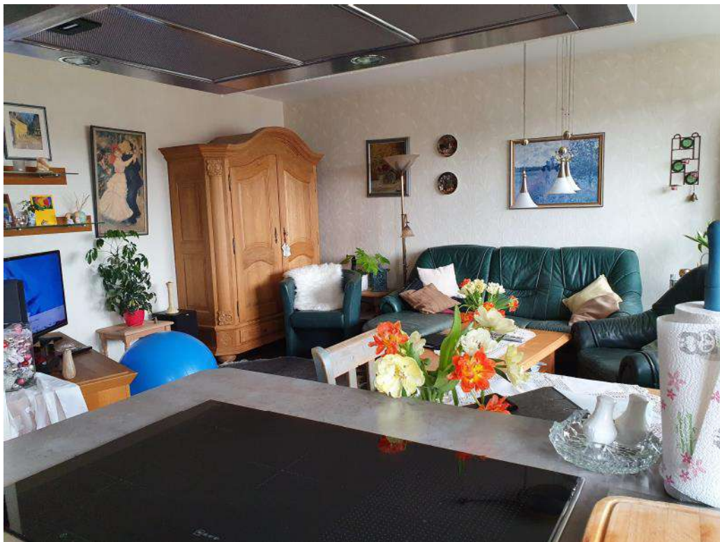
Blick von der Küche ins Wohnzimmer